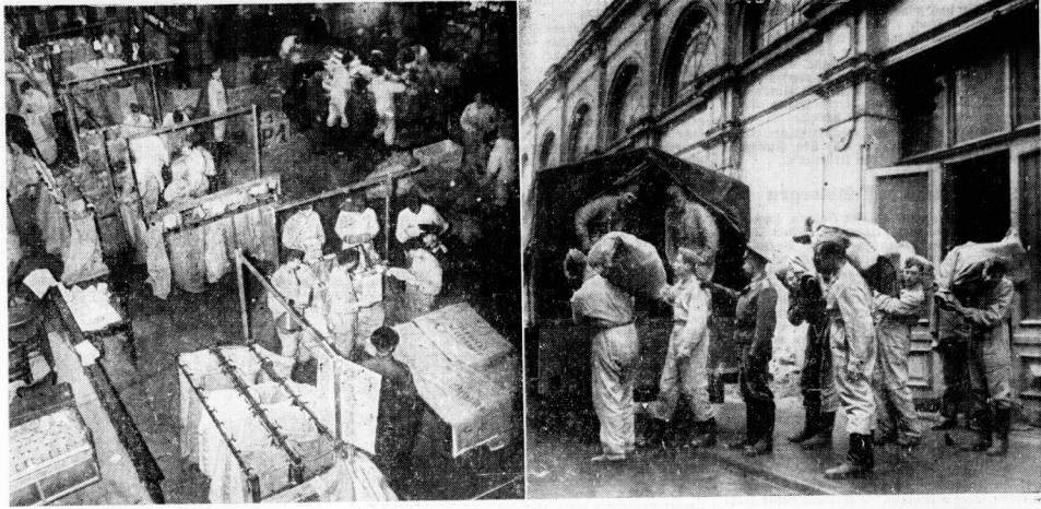
Blick in die Feldpostpäckchenstelle im Wintergartensaal — Soldaten beim Abtransport sortierter Post

Der Wintergartensaal von der Reichspost gemietet — Soldaten helfen den Beamten