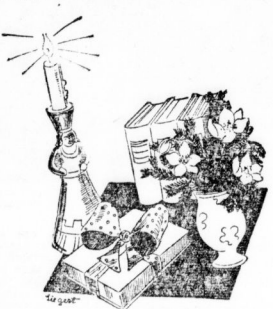
Auch den Weihnachtsstille schmeichelt mit frischen...