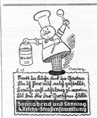
Donnerabend und Sonntag 4. Reichs-Straßensammlung

Nach amtlichen Meldungen hat das durch Völkernbrüche entstandene Hochwasser, das nenerdings weiter heftig, außer Schiffen, auch Menschen und Vieh gefodert. Die Zahl der Ertrunkenen liegt noch nicht fest. Adriano ist ohne Licht, da das Elektrizitätswerk unter Wasser liegt. Alle Brücken sind überflutet. Der Gropsoverkehr mit Italien ist seit drei Tagen eingestellt, die Eisenbahnen sind seit fünf Tagen 2000 Wohnhäuser drohen einzustürzen. Trotz heftigen