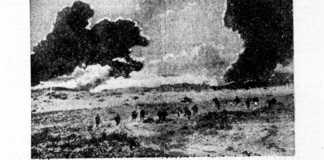
Hefige Kämpfe in der Wüste. Der italienische Wehrmachtbericht hat in der letzten Zeit heftig Kampfe gemeldet und dazu von dem heldenhaften Widerstand der libyschen Truppen berichtet. Die Aufnahme zeigt Itallener bei einem Gegenangriff, der im schweren Feuer der englischen Artillerie stattfand.

Entsendung der Türkei Wien, 13. Dezember. Die österreichische Regierung hat die Entsendung von österreichischen Truppen nach der Türkei angekündigt.