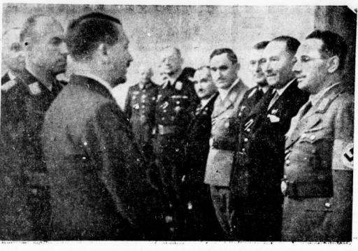
Der Führer empfing, wie wir bereits berichteten, die Mitarbeiter des Reichsministeriums für Bewaffnung und Munition und brachte ihnen seinen Dank für die besonderen Verdienste zum Ausdruck. Hinter dem Führer Reichsminister Dr. Todt