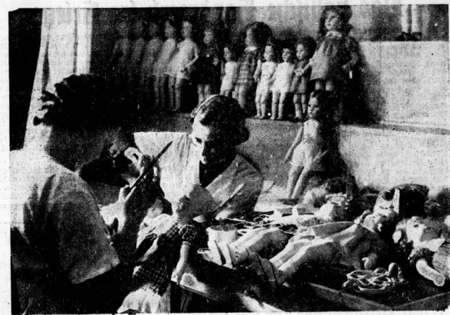
Hochbetrieb in einer Puppenwerkstatt

Durch das Gefrey ihres anderthalbjährigen Kindes wurde in Ringe (Dänemark) eine Familie vor dem Hungertode bewahrt. Die Eltern konnten nicht mehr weiter und besaßen keine Gelder mehr, erst, daß das Schlafzimmer mit Rauch erfüllt war. Der Unfall war aus einer Mauer eingedrungen, die durch einen überbelegten Ofen in Brand geraten war. Die Familie hatte sich dem mörderischen Schicksal des Schlafzimmers gerade noch Zeit, sich zu retten und die Feuerwehre zu alarmieren.