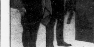
Die Eröffnung des Festes der Jugend an den Brandbergen.