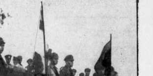
Die Eröffnung des Festes der Jugend an den Brandbergen.