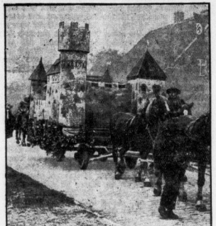
Modell der Horburg im Festzug

Horburg. Innerhalb weniger Wochen konnte im Kreis Horburg die dritte Jahrestagung der Kreisvereine stattfinden. Nach Hirschberg und Merseburg leitete das kleine Horbürger Horburg am Sonntag seinen Geburtstag, den es eben wie die Stadt Hirschberg, in den Kampf und Sieg beizutreten. Die ersten Anstöße kamen von der Stadt Horburg, die im Kampf und Sieg beizutreten. Die ersten Anstöße kamen von der Stadt Horburg, die im Kampf und Sieg beizutreten.