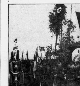
Der Tag der mitteldeutschen Arbeitsfront