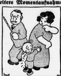
„Mutter — hätten mir uns doch höchstens mit Vater verlobt!“