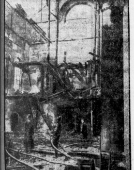
Die holländische Kirche niedergebrannt... am 27. Juli... durch einen Brand... zerstört...