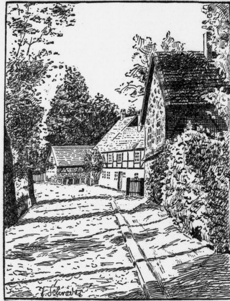
Dorfstraße / Zeichnung von W. Schröder

„Der Herr Oberst?“ „Der Herr Oberst?“ „Der Herr Oberst?“