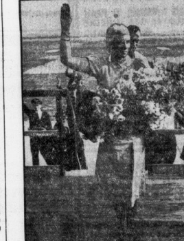
Walbo fliegt den sibirischen Weg... ein... Verbrechen... ein... Verbrechen...