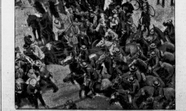
Bildtelegramm vom großen Streik in Straßburg, bei dem es zu Zusammenstößen zwischen Streikenden und Polizei kam.

zusammengetreten. Von den 120.000 Mitgliedern, die Frankreich zählt, gehören 90.000 dem Nationalverband an. Er kann also als die Stimme der französischen Streikbewegung gelten. Die Unzufriedenheit und die Unruhe gegen die Regierung sind die beiden Charakteristika der Tagung. Wie dies so oft in Frankreich geschieht, sind dem Streikverband Verordnungen hinsichtlich Gehaltsveränderungen und Alterspensionen gemacht worden. Aber die Regierung hat verweigert, ihre Versprechen einzulösen. Zahlreiche Gewerkschaften und mitglieder der Arbeiterschaft haben sich dem Streik angeschlossen. Der Generalfstreik formulierte nach langen Diskussionen, in denen die Regierung auf bestmögliche Angriffe wurde, den Bescheid, den Samstagsstreik der Kammer mit einem selbständigen Streik zu beenden und alle Beziehungen zur Regierung abzubrechen. „Damit werden wir Zalambur zu Fall bringen“, triumphierte ein Kongressler. Der Saal nahm diese Worte mit entsetzten Beifall auf.