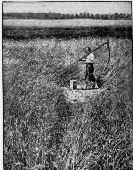
Die blutende Grenze

Die Unfreiheit hatte geschlossen. Es war unser letzter Ausflug. Unsere Räder flüchten durch ländliche Straßen. Warum verbringen wir die Ferien nicht eigentlich gemeinsam? war er hin. — Ich bin froh, dich mal acht Wochen nicht zu sehen; überdies hab' ich doch noch meine Mutter. — Glaubst du, daß ich vom Mond gefallen bin und keine Eltern hab'? — Ich weiß, sie wohnen richtig am Mond, im Freiland, wo's keine Sorgen gibt. Deshalb bist du ein so komischer Mensch geworden. — Wie's fomitich' bliff er mich an. Wir getreten in Sand. Mir war's gerade recht.