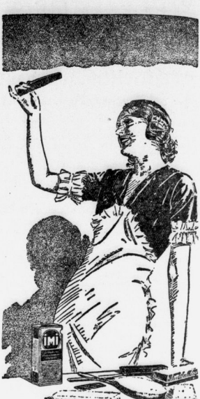
Ein Bild aus dem Leben

20-Zim.-Wohn. 1000 Stk. 10000 10000 10000 10000 10000 10000 10000