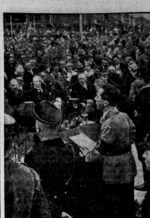
Reichspropagandaminister Dr. Goebbels bei der Eröffnung...