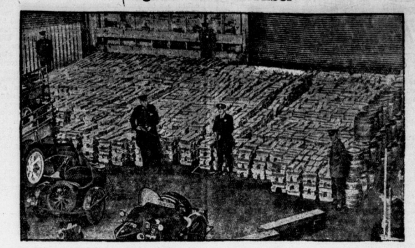
Im Hafen von San Francisco traf aus Indien eine Ladung von 9000 Silberbarren im Werte von fünf Millionen Dollar ein.