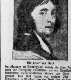
Ein neuer von Dyck im Museum zu Birmingham wurde ein altes Porträt nach der Zeichnung zweifelsfrei als ein Gemälde des berühmten niederländischen Malers van Dyck festgestellt.