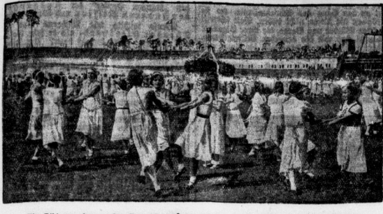
Ein Bild von dem großen Fest der deutschen Schule, das der VDA. im deutschen Stadion in Berlin veranstaltete. (Siehe auf S. 1.)