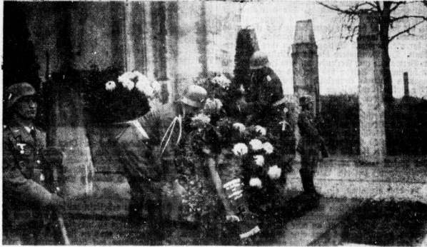
Kranzniederlegungen am Grabe Oswald Boelckes in Dessau.

Was wir an Boelcke besonders schätzten, das... Kameraden aus dem Weltkrieg