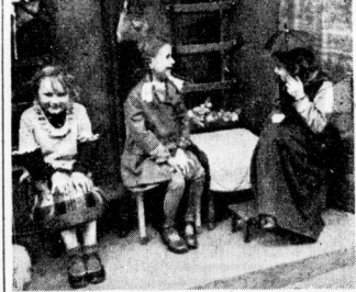
In einem Haustor auf dem Sandberg spielen drei Mädchen „Tantenbisch“...