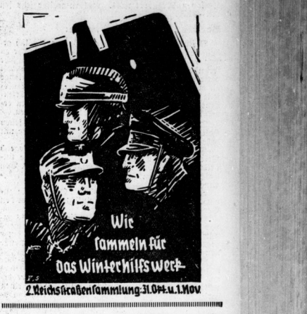
Wie kommen wir das Winterhilfsweck