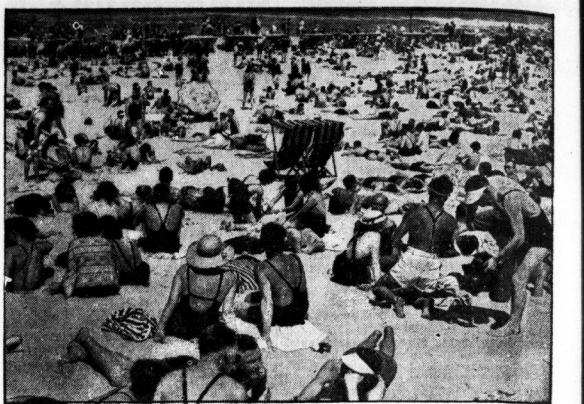
Während bei uns graues Novemberwetter herrscht, beginnt bei unseren Antipoden in Australien der Frühling. So wurde an der Küste die Badesalzen ersten Tage.