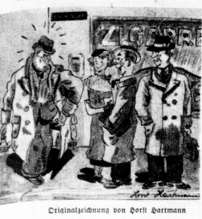
Originalzeichnung von Dorst Hartmann