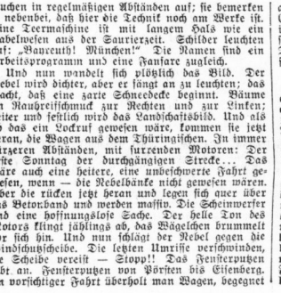
(Originalzeichnung: Kurt Marholz)