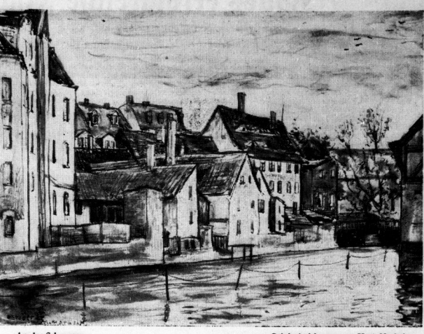
An der Schwemme. Originalzeichnung von Kurt Marholz.