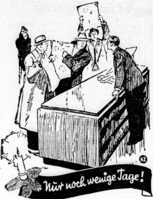
Nur noch wenige Tage!