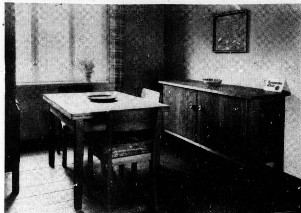
Wohn- und Esszimmer in Kielerholz für die Stadt- oder Siedlerwohnung.

Man erlebt es immer wieder, daß Menschen ihrem Heim ein neues, zeitgemäßes Gesicht geben möchten. Sie leben häufig in den Schattierungen moderne Möbel und Ständergeräte und vergleichen dann mit ihrem Heim. Immer sind sie dann von dem Wunsch befeuert, endlich einmal gründlich aufzuräumen und sich, wenn auch nicht auf einmal, neu einzurichten.