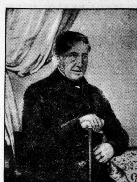
Ludwig Wucherer (1800)