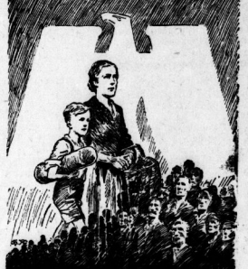
Ein Volk Eine Gemeinschaft Ein Opfervolle