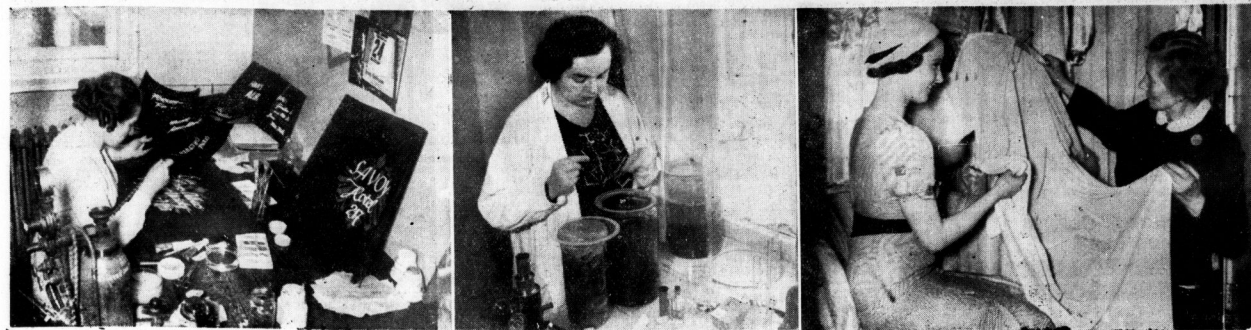
Unbekannte Helferinnen am Film

Von links nach rechts: Bei der Herstellung von Filmtiteln, die ein Kapitel für sich bilden und ihr jedes Film eine neue künstlerische Lösung verlangen. — Für die Mikro-Aufnahmen eines Kulturfilms werden Mikro-Lebewesen aus dem Zuchtbotzich gefischt. — Die erfahrene Garderobierist ist die Beraterin der jungen Schauspieler in Kleiderfragen.