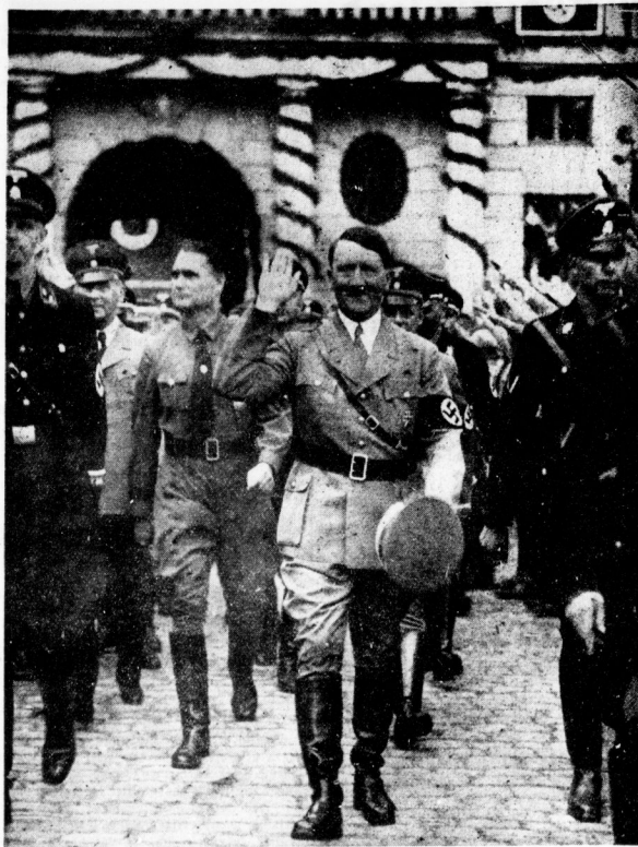
Von der Zehnjahrestfeier des 1. Reichsparteitages der NSDAP. in Weimar. Links: Der Führer schreitet die im Schloßhof zu Weimar aufgestellten Standarten ab. Rechts: Der Führer beim Verlassen des Weimarer Schlosses nach dem Staatsmahl im Festsaal. Hinter dem Führer sein Stellvertreter Reichsminister Rudolf Heß und (weiter nach links) Reichsminister Dr. Frick.