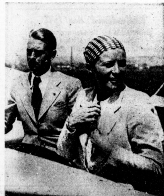
Bilder vom Sport. Links: Die Kalifornierin Helen Jacobs, die im Frauen-Einzel des Wimbledon-Turniers über die Dänin Hilde Sperling mit 6:2, 4:6, 7:5 siegte. Mitte: Der Start der Klasse A bei dem am Sonntag in Hohenstein-Ernstthal bei Chemnitz ausgetragenen Großen Preis von Europa für Motorräder. Rechts: Erste Aufnahme der bekannten deutschen Sportligerin Elly Beinhorn mit dem erfolgreichen Rennfahrer der Auto-Union, Bernd Rosemeyer, nach der Verlobung. Das Paar landete auf dem Chemnitzer Flugplatz, um dem Motorradrennen in Hohenstein-Ernstthal beizuwohnen.