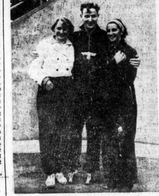
Neue deutsche Meister