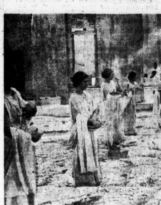
Nach dreißigstündigem Lauf trat die Olympia-Statette in der griechischen Hauptstadt ein. Unser Bild zeigt, wie der Wegleiter die Fackel aus der Hand des Parthenon trägt, um dort eine Schale, die auf dem Altar steht, zu entzünden.

Die olympischen Fackellaufer haben ihren Lauf programmäßig fort. Dienstagabend wurde die Fackel um 8 Uhr abends am Grab des unbekannten Soldaten vorbei aus Athen getragen.