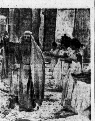
Die griechischen Hauptstadt ein. Unser Bild zeigt, wie der Wegleiter die Fackel aus der Hand des Parthenon trägt, um dort eine Schale, die auf dem Altar steht, zu entzünden.