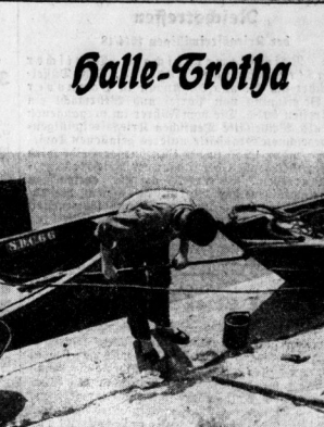
Der Halenaufenthal wird zum Ueberholer der Kähe benutzt.