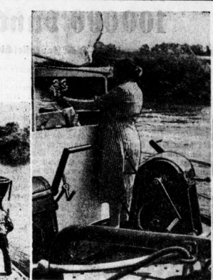
Für Blumenkästen und Blumenschmuck ist die Schifferstr. zuständig.