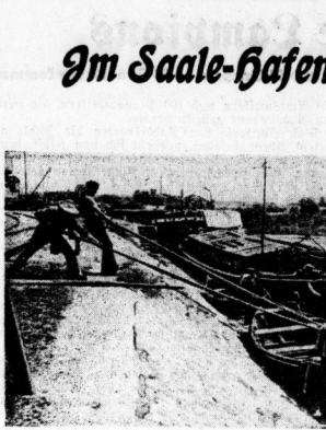
Der Handkahn wird zu Wasser gelassen.