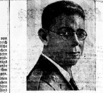
General Mola, Führer der Nordgrupe der spanischen Nationalisten.