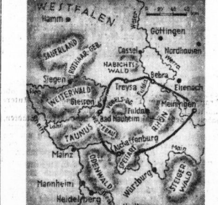
Übersichtskarte zum Herbstmanöver des Gruppenkommandos II.

Immer wieder mit außerordentlich heftigen Regenböen auf, das aber erfreulicherweise recht vorüberzog.