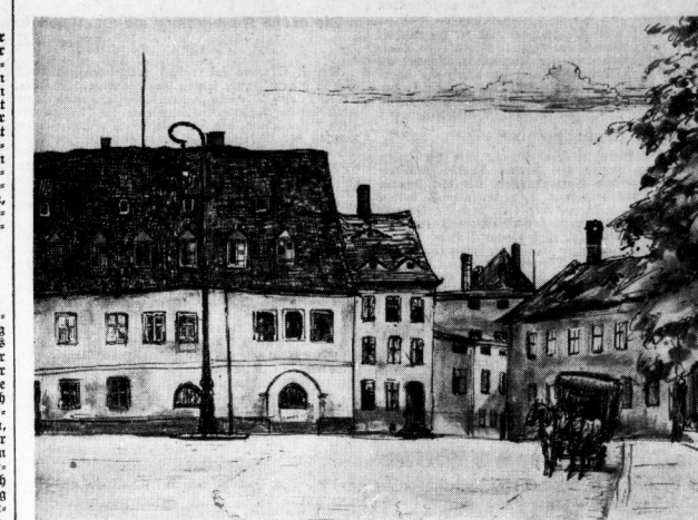
Blick auf den Domplatz. (Originalzeichnung von Kurt Marholz)