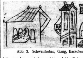
Abb. 3. Schweineställe, Gang, Backofen

„Die rüchardischen Spiele der 19. und 20. werden wie folgt angelegt: 19. 4. 86 Nr. 27. 1900: Wader 3 — Borussia 3 (Eintracht)“