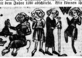
Abb. 2. Der Aussätzige, der Stimme, der Blinde