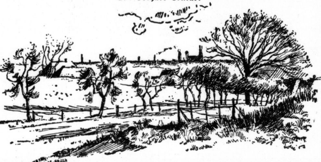
Blick von den großen Brandbergen auf die Stadt (Originalzeichnung von Horst Keller)