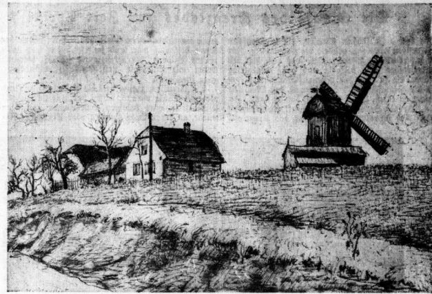
Der Mühlenberg bei Benndorf