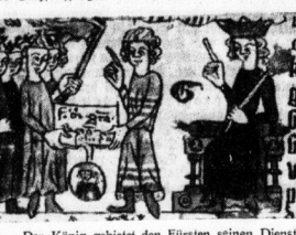
Abb. 1. „Der König gebietet den Fürsten seinen Dienst“