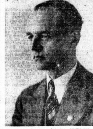
Aufnahme: Dr. Conrad

In seinem neuen Wirkungskreis hat Dr. Conrad... (Text continues with details of his new role)