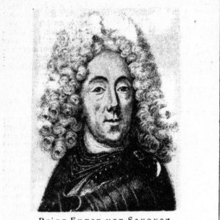
Prinz Eugen von Savoyen

Die Folgen des Schneesturmes, der über ganz West- und Süddeutschland tobte und allerorts großen Schaden anrichtete: In der Nähe von Usingen bei Frankfurt, wo der Sturm besonders wüthete, brachen selbst starke Telegraphenmasten durch. (Nach Bildzeitung, 8.)