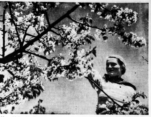
Unter blühenden Bäumen