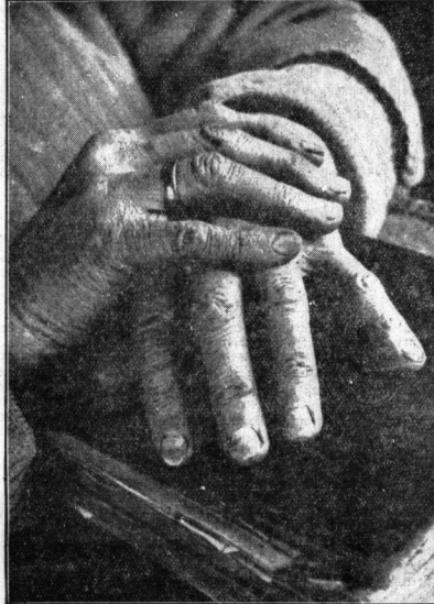
Von den großen Händen geht der Glanz nie erlöschender Güte aus

Meine Blicke wandern weiter zu der alten Frau, die neben den seelenlosen Händen sitzt. In ihrem Schoß liegen zwei hartverarbeitete Hände. Welche Unterschiede! Meine Blicke vergleichen. Ich küsse, wenn diese Hände, die weise und die harte Hand, zusammenkämen, dann müßte sich die weise Hand beschämt zusammenfallen, beschämt vor der eigenen Veere, die durch die vom Schicksal gezeichnete Hand der alten Frau noch unterstrichen wird.