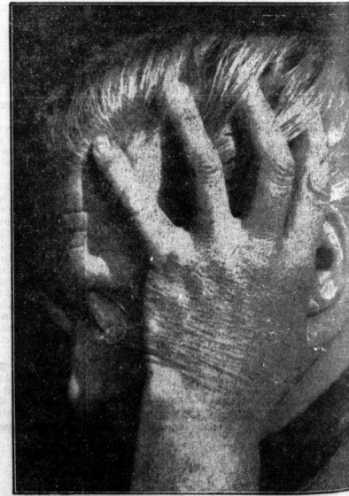
Wie selten mögen diese Hände talentlos gewesen sein