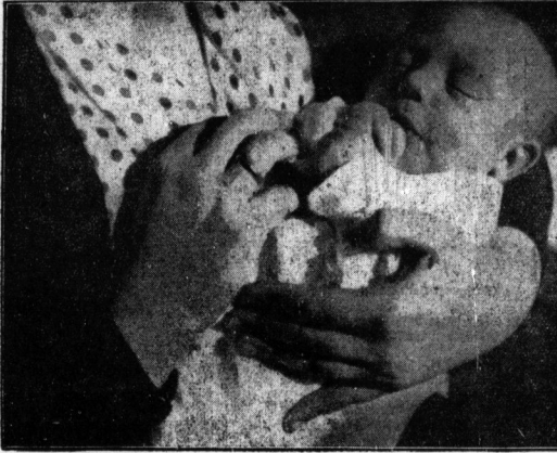
Die Schalen schließen sich die Hände um das kleine Geschöpf...

Das ist die große Gnade der Mutterhände, daß sie geöffnet sein dürfen vom ersten Tag ihres Mutterseins bis zum letzten Augenblick ihres Lebens, daß sie in immer tröstlicher Weise geben können, je mehr das Leben an Härten ihnen aufgebürdet hat, und daß sie nie zu alt sind, um nicht noch beten zu können für die, die schon in diesen Händen entwachsen sind. Deswegen schließt