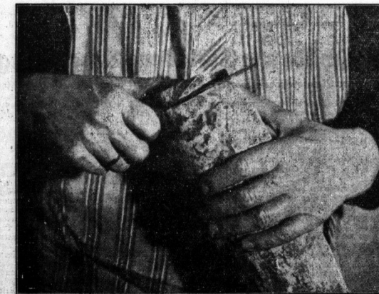
Die Hand kennt die Sorgen um das tägliche Brot

Je mehr ich die alten Hände betrachte, um so tiefer werden sie mir. Jede Einzelheit, jede Falte kommt mir vertrauter vor und spricht von ihrem Leben. Tief schneidet der Goldring in den Finger ein. Mit einemmal weiß ich, warum ich diese Hände lieben muß. Es sind die Hände einer Mutter, Mutterhände. Alle Menschen sind mir plötzlich fern, und nur dieses eine Wort schwingt wie ein Glockenton in mir. Ist es nicht, wenn wir dieses Wort ansprechen, als wenn eine ganze Welt voll Liebe sich erschloße, eine Welt, die immer schöner wird, nach der wir immer mehr Sehnsucht bekommen, je mehr wir vom Leben wissen? Und wenn wir zurückblicken, ist es dann nicht, als gehe unser Weg unmittelbar von den schützend gebreiteten Händen der Mutter aus, die uns wie eine Ruhe und stille Zuversicht begleiten? Wie eine Kette würde es das ganze Erdenrund umspannen, wenn alle Mütter sich die Hände reichten. Und überall, wo Mutterhände schafften, ist Liebe, ist Heimat und Zuhause sein. Mutterhände, Mutterhände tauchen auf, bildhaft, aufstrebend, um langsam zu verfliegen.