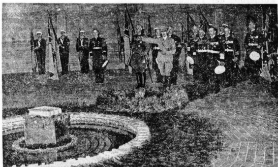
Links vom Führer Generalleutnant v. Blohmberg, rechts Generalleutnant Dr. h. c. Raeder. Vor dem Gedenkstein mit dem Ehrenkreuz der deutschen Kriegsmarine der Kranz des Führers.

Der riesigen Mahmal trat am Sonnabendvormittag die Generation des Weltkrieges zur Feier. In der Ferne sah man die weiße Spitze der Weichselnde. Die Formationen der Weichselnde hatten ihre Abordnungen entlassen. Vom Turm bis zum Ehrenmal bildeten die Schiffe eine Kette. Alles wartete auf den Führer, der die Weichselnde zum Sonnabend an Bord des "Wilhelm" verbracht hatte. Alle Blicke sind nach der Ferne gerichtet, auf der die "Nixe" erwartet wird, an deren Bord der Führer am Morgen reisen wird. Die Spannung erreicht allmählich ihren Höhepunkt. Da ertönen plötzlich aus der Ferne zuweilen leise türmende Heulrufe. Immer lauter werden sie. Durch Lautsprecher wird verkündet, daß der Führer die Front der Kameraden des Marine-Ehrenmals betrat. Der Führer kommt! Die Ehrenkompanie der Kriegsmarine präsentiert das Gewehr. Das Deutschlandlied klingt an.