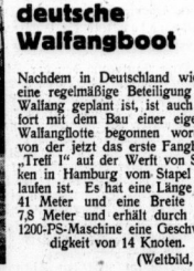
Nachdem in Deutschland wieder eine regelmäßige Beteiligung am Walfang geplant ist, ist auch sofort mit dem Bau einer eigenen Walfangflotte begonnen worden, von der jetzt das erste Fangboot „Treff 1“ auf der Werft von Stücken in Hamburg vom Stapel gelassen ist. Es hat eine Länge von 41 Meter und eine Breite von 7,8 Meter und erhält durch eine 1200-PS-Maschine eine Geschwindigkeit von 14 Knoten.