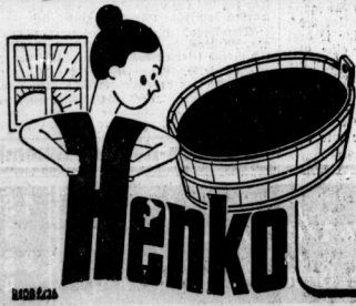
Senkels Wäsche- und Bleichoda ~ Die Wäscheblei für 13 Pf.

Diensta nicht ab verfü wenn, was bei der werden in kann, daß nicht fäh hinter Die Sicher eile in französi Vermeidun den Gehe fingermas stehet un den Zier wie hinter geföhnte Blutausfl Blutausfl Wahrschein Es blie des Stroh genetische Zurück Es ist ogen eine man nicht schießen Widigung dop des D Am Mont t 1938, der germanis sich nicht erweitert wurde kann teil kann teil des Reich nicht ent ber in Ober sich nicht Lichtausfl wurde wie leide trotz V, Gene am Grabe den Zier des Wagen, daß Geföhnte manier bel gemindert aus weitere Der Ratt C Am Mont großen D Angelegen Portugall nach, so daß Wagen gem Angelegen den von im sich nicht französi geföhnte geladen, daß bei der Ver Sticht her Anfänger Angelegen auf einem Z hauenden a treiben, die Wahrschein Kesslich