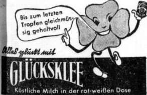
Köstliche Milch in der rot-weißen Dose