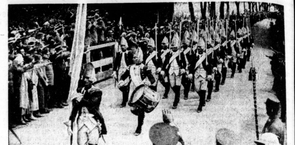
Die Kriegskameradschaft Wangerin in Pommern, die Urzelle des Reichskriegerbundes Kyffhäuser, feierte ihr 150jähriges Bestehen. Bei der Feier marschierte auch eine Abteilung in alten friedericianischen Uniformen mit der alten Fahne und Regimentstrommel auf.