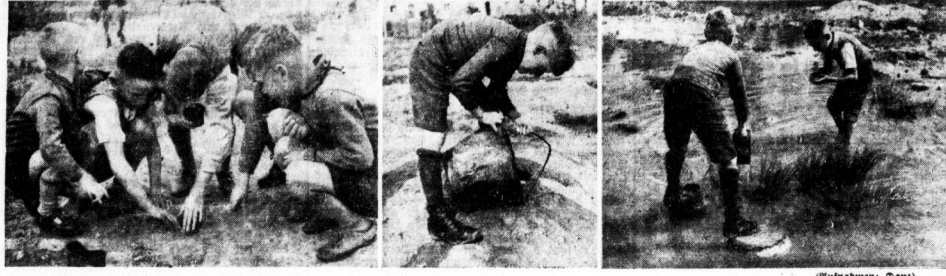
Die „Netze“ werden ausgeworfen