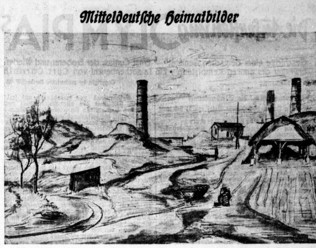
Die Bennisfelder Kalkwerke. Zeichnung: Kurt Marholz