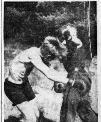
Pimpe auf Unzen . . .