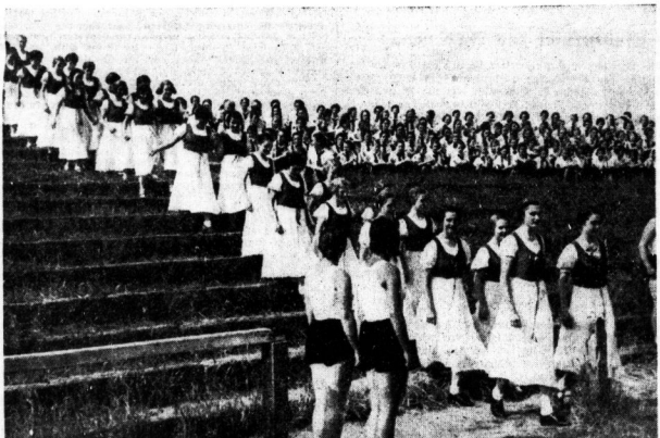
Einzug der Volkstänzerinnen

Den Höhepunkt und Abschluß findet das Deutsche Jugendfest mit den Sommerwendfesten, die die HJ, im ganzen Reich in der Sommerferienzeit durchführt. Eine einige und geschlossene deutsche Jugend zieht um die Feuer verbrannt und erneuert ihren Schmutz, dem Führer zu dienen bei seinem Werk, Deutschland zu schmücken für die Ewigkeit. La.