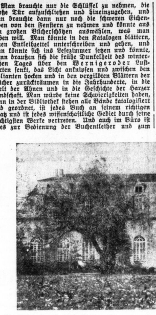
Das Bibliotheksgebäude in Wernigerode

90000 Bände in der geschlossenen Stolberg-Wernigeroder Bibliothek - Bibeln in 42 Sprachen - Einst eine Stätte der Gelehrten der ganzen Welt