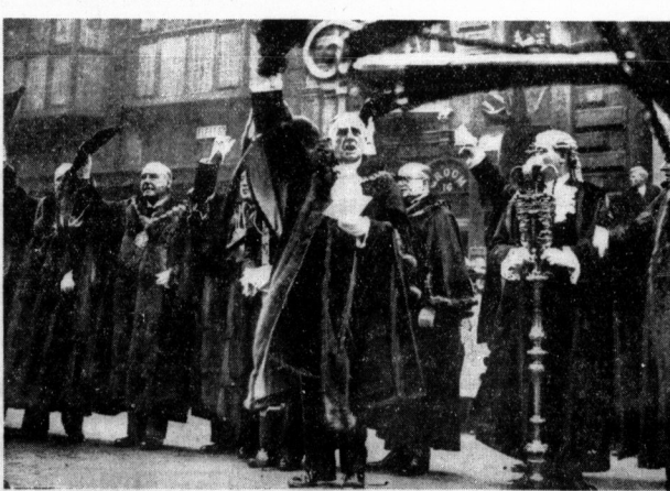
An der Stadtgrenze von London bringen der Bürgermeister und die Sheriffs nach der Verlesung der Proklamation...