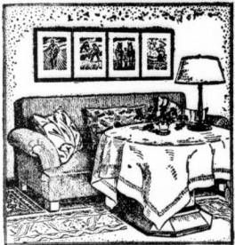
Eine Reihe guter Holzstühle über dem Sofa