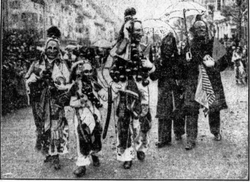
Lustiges Fastnachtstreiben in einer süddeutschen Stadt (Schers Bilderdienst)