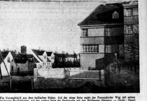
Ein Vorstadthaus aus dem halleschen Süden: Auf der einen Seite endet der Passender Weg mit seinen modernen Balkenbauten, auf der anderen Seite die Dorfstraße mit den Bollberger Häusern. - (Aum.: Danz)