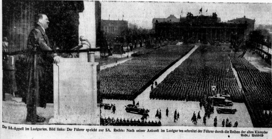
Der SA-Appell im Lustgarten. Bild links: Der Führer spricht zur SA. Rechts: Nach seiner Ankunft im Lustgarten schreitet der Führer durch die Reihen der alten Kämpfer.

Als der Führer die Treppe emporstieg und nun der Menge sichtbar wurde, die vor dem Dom und an den anderen Ecken des Platzes sich hatten erheben begeisterte Heilrufe auf, die sich immer wiederholen. Nun meldete der Stadtschiff die angetretene SA. Der Führer tritt vor und begrüßt keine SA-Männer mit dem Wort: „Heil SA-Männer!“ Die Anführer des Reichsbürger hält es für notwendig, die SA-Männer zu begrüßen. Der Stadtschiff führt kurze Worte der Begrüßung, die in eine Gruppe der gelassenen Kameraden ausfallen. Die Säupter entließen sich, die SA-Männer werden geübt, und das wird von allen Kameraden erfüllt. Nach dem Stadtschiff ergriff Reichsbürgerkommandant Dr. Goebbels das Wort, der in feiner Eigenheit als Berliner Gauleiter die SA-Männer in der Reichsbürgerstadt willkommen heißt. Geheißer Beifall dankt seinen Worten. Und dann schreitet, während von allen Seiten aus neue Heilrufe über den Platz drängen, Adolf Hitler zur Nebentribüne. Die letzten Worte des Führers werden immer wieder unter-