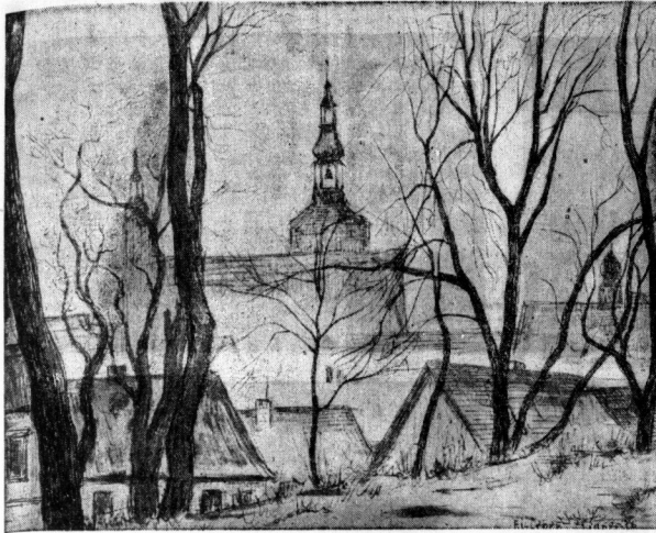
Eisleben im Morgennebel: Blick durch den Stadtpark auf die Marktkirche. Zeichnung Kurt Marolt