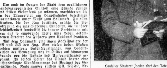
Gauleiter Staatsrat Jordan ehrt den Toten