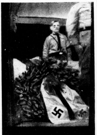
Blick auf den Sarg im Konduktwagen