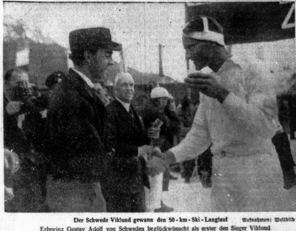
Der Schwede Viklund gewann den 50-km-Ski-Langlauf. Erikprinz Gustav Adolf von Schweden beglückwünscht als erster den Sieger Viklund.