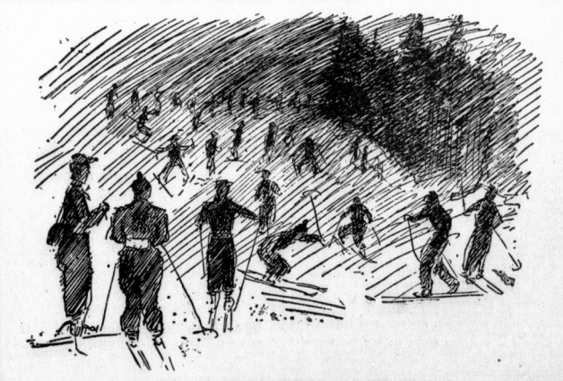
Auch der Stiphagen der Oberhofer Gottweise war in dichten Nebel gehüllt