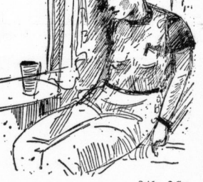
... in einer stillen Ecke auf der Heimfahrt

glatter Fläche und mit dem anderen auf höchstem... (Text continues the description of the winter scene and the train journey.)