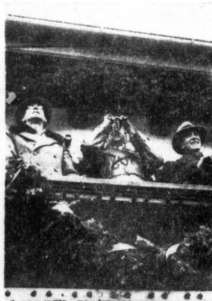
Der Führer verfolgt am Schlußtag der Winterspiele das Ski-Spezialspringen auf der Olympiaschanze. Rechts: Minister Dr. Goebbels.