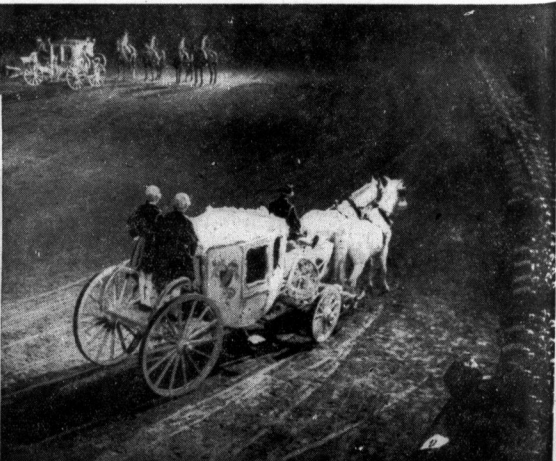
Rokokofiguren aus der Revue „100 000 PS“ in der Deutschlandhalle.