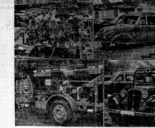
Oben: Bild gibt einen Querschnitt durch die Sonnabend erstellte große Schau der Motorfahrzeuge in Berlin. Unten links: Blick in die Halle; oben rechts: Moderner Lastwagen mit Holzgasantrieb; unten rechts: Ein neuzeitlicher Krankenwagen.