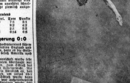
Von dem großen hallischen Schwimmer... Von der deutschen und Europameisterin Lina Esser-Windorf...

Die schwedische Mannschaft führte die Rangliste an und zeigte eine hervorragende Leistung in verschiedenen Disziplinen. Die amerikanische Mannschaft belegte den zweiten Platz.