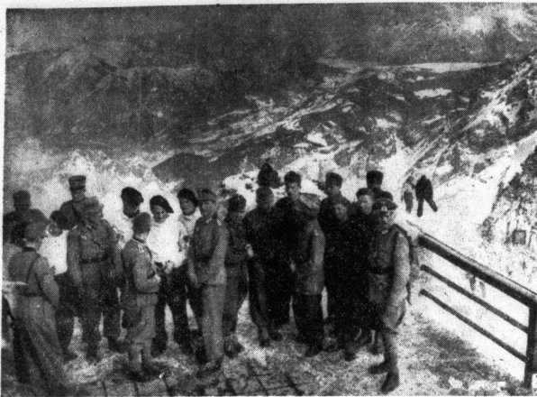
Ausländische Offiziere besuchten die Zugspitze. Unser Bild zeigt sie unter Führung von Offizieren der deutschen Wehrmacht auf der Aussichtsplattform des Zugspitz-Hauses. (Weltbild). — Rechts: Die Engländerin Cecilie Colledge, die im Eiskunstlauf die Silberne Medaille errang. (Presse-Bild-Zentrale)