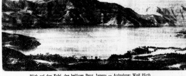
Blick auf den Fuji, den heiligen Berg Japans

Ich habe die ersten Segelflüger gesehen, die in Japan fliegen. Ich habe die ersten Segelflüger gesehen, die in Japan fliegen. Ich habe die ersten Segelflüger gesehen, die in Japan fliegen.