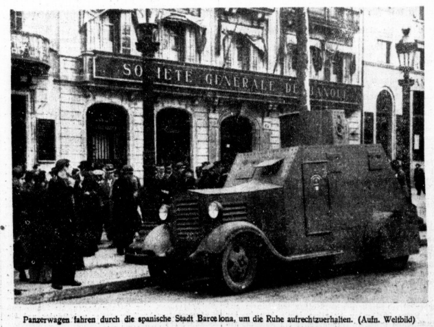
Panzerwagen fahren durch die spanische Stadt Barcelona, um die Ruhe aufrechtzuerhalten.

Die italienische Öffentlichkeit sieht noch ganz unter dem Eindruck des ersten Tages nach Rom. Die Berichte von der Front liegen bevor, daß zu der Armee des geschlagenen Mas Mungabie die besten alpinistischen Truppen gehört hätten. Man hofft in