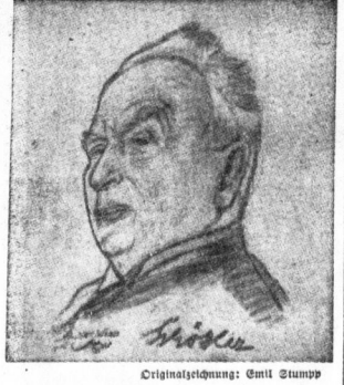
Originalzeichnung: Emil Zump