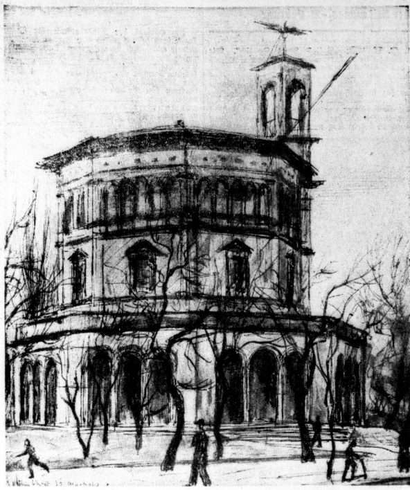
Das Museum der Nationalsozialistischen Erhebung in der Hindenburgstraße