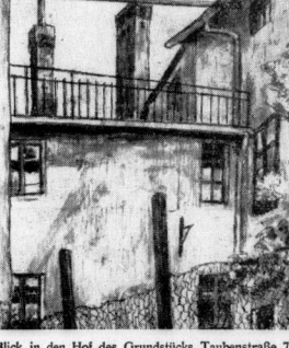
Blick in den Hof des Grundstücks Taubenstraße 7 in Glaucha - Zeichnung: Kurt Marholz