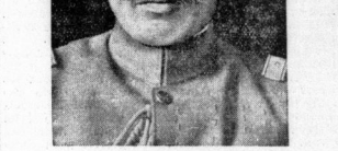
Der frühere Kriegsminister Araki. Er spielt bei den Verhandlungen um die Neubildung der japanischen Regierung und um die Beilegung der jüngsten blutigen Zwischenfälle eine besondere Rolle.

Die Kammer hat gestern den Ruffenpakt mit 333 gegen 144 Stimmen bei einer Beteiligung von 466 Abgeordneten angenommen.