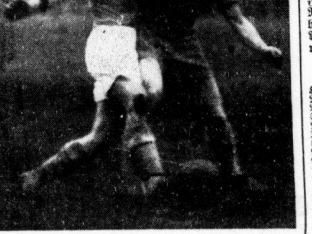
Stun, Glanzfuß... Stun, Glanzfuß...