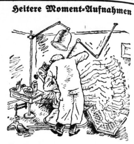
„Oh, Herr Doktor! Wenn wir doch ohne Sie leben würden.“