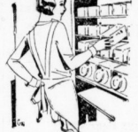
Gläser mit Aluminiumdeckel.

Der geschätzten Not kann heute abgeholfen werden. Verwenden wir doch die Glasflammen zum Aufheben der Aufbaumotoren. Glas ist durchsichtig, sauber und leicht zu reinigen. Die Ausdehnung, überdies und jederzeit greifbar die Vorrate in Glasbehältern aufgehoben sind, wie schon und bevor die Hausfrau sich damit bedienen kann, zeigen die beiden Abbildungen. In diesen Glasbehältern wird die Hausfrau ihre Vorrate einwandfrei untergebracht. Jetzt kann man vor dem Öffnen des Behälters nicht mehr so leicht übersehen, was für sie mit wenigen Worten die Vorteile aufzählt.