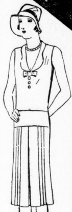
Apertes Sportkleid It. Bild aus Trikot- Charmeus I. schön. Pastellfarb., mit gestr. mit abstech. Kragen 12.75

können Sie erst ganz ermessen, wenn Sie die angebotenen Qualitätswaren sorgfältig prüfen! — Wir können Ihnen in den Schaufenstern nicht alles zeigen. Bitte besuchen Sie uns und Sie werden erstaunt sein, welche enormen Vorteile wir Ihnen, gestützt auf unsere eigenen Fabriken und großen Einkaufshäuser, bieten!