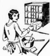
Strom- und Glasflammen.

Die steigenden Anforderungen an die Hausfrau machen es notwendig, die wichtige Arbeitstätigkeit der Küche, mit geschonten anzustellen, die ihr Kraft, Zeit und Arbeit ersparen. Wenn auch auf diesem Gebiet schon manches Nützliche erreicht wurde, so bleibt doch noch viel mehr zu tun übrig. Eine weitere Erleichterung, die es wohl verschiedene praktische Einrichtungen gibt, daß aber deren Stellen für die übergroße Mehrzahl unserer Hausfrauen unerschwinglich sind. Einer Erleichterung der Küchenarbeit bedürfen aber gerade diese Hausfrauen am meisten. Viel wichtiger als die Beschaffung praktischer aber teurer Einrichtungen für die kleine oder mittlere Hausfrau ist daher die Beschaffung preiswerter, jedoch sehr wirksamer Geräte für die Küche.