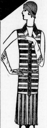
Fisches Toilette-Kleid It. Bild in wunder- schönen römischen Streifen mit abstech. Gürtel 19.75