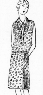
Jugendliches Kleid It. Bild aus Wasch- seide, mit u. geschlos- sen zu tragen, schöne hell gemaltete Dessins 6.90