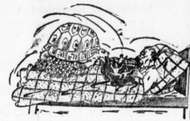
Ein schwerer Traum plagte mich in der Nacht.