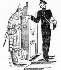
Vor mir stand ein Postbote.