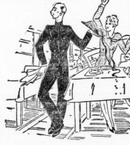
Der Beruf des Speisewagen-Kellners hat seine Tücken.