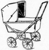
Kinder-Klappwagen mit Verstellbar auf weitem (Längengürtel) und mit geöffnetem, verstellbar in solider Ausführung 36.50