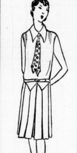
Fisches Sportkleid It. Bild aus Trikot- seide, mit u. geschlos- sen zu tragen, schöne Pastell- u. Blau- Streifen 7.50