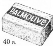
40 Pf. Kaufen Sie noch heute!

ACHTUNG! Echte Palmolive wird nur in Originalpackung verkauft: grünes Papier, schwarzes Band mit „Palmolive“ in Goldbuchstaben. Palmolive wird nie unverpackt verkauft.