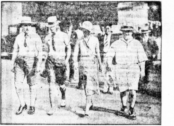
Netzortler in kurzen Dosen, wie man sie während der Hitze vielfach in den Straßen sieht.