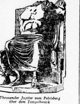
Thronende Jupiter vom Petrisberg über dem Tempelstark