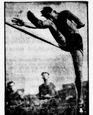
Beim Rückhandschlag. Stellt von Hans Kreyenitz

Ball entweder mit Vorhand oder mit Rückhandschlag zurückstreifen zu lassen. Im perfekten Gebrauch den besten Griff für Rückhandschlag wie für Vorhandschlag, aber für den Anfänger ist der allgemein übliche Rückhandgriff besser.