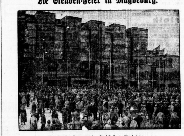
Die Stenden-Feier vor der Stadthalle in Magdeburg. Am 20. Juli begann Magdeburg die 200jährige Geburtsfeier des großen Generals Friedrich Wilhelm v. Stenden, an der die Mitglieder der Carl-Zeus-Vereinigung und der Stenden Society of America teilnahmen. Im Vordergrund der Festlichkeiten wurde eine Gedenkfeier, an der die Vereinigung Carl-Zeus gefeiert, eröffnet.