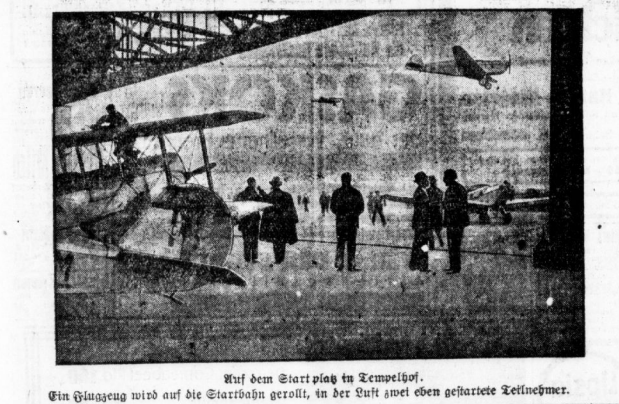
Auf dem Startplatz in Tempelhof. Ein Flugzeug wird auf die Startbahn gerollt, in der Luft zwei eben gestartete Teilnehmer.

Seite an ihm ganz verwinden soll, denn dann würde die erste, die fischen würde, daß er kein rechter Mann ist — nur möchte sie, daß ihr persönlich die Seite nicht angestreift werde. Dies im persönlichen Verkehr durchzuführen, ist ihre Naturanlage, und auf dieser betruht tatsächlich die ganze Seite der beiden Zitate, die raube oder die ganze, so ist er im ersten Teil ein Schwächling, im zweiten ein Hochflieger. Das Verhältnis der Frau hat ein Leben auf beiden Seiten, und darum muß die Förderung der Kameradschaft entweder zur Vererbung führen oder zu einem Krieg.