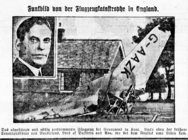
Das abgeleitete und völlig getrimmerte Flugzeug bei Grosvenor in Kent. Unbenutzt der frühere Zeppelinpräsident von Hindenburg, Graf von Zeppelin.

Das abgeleitete und völlig getrimmerte Flugzeug bei Grosvenor in Kent. Unbenutzt der frühere Zeppelinpräsident von Hindenburg, Graf von Zeppelin, bei Grosvenor in Kent. Unbenutzt der frühere Zeppelinpräsident von Hindenburg, Graf von Zeppelin.