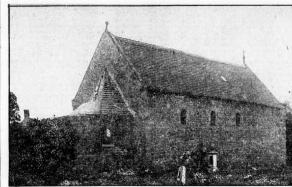
Die alte Kapelle im Bülberger Gottesacker.

Im Gottesacker von Bülberg liegt ein wirkliches Kleinod, das jetzt, wie wir vor einigen Tagen berichtet, einer Erneuerung unterzogen wird.