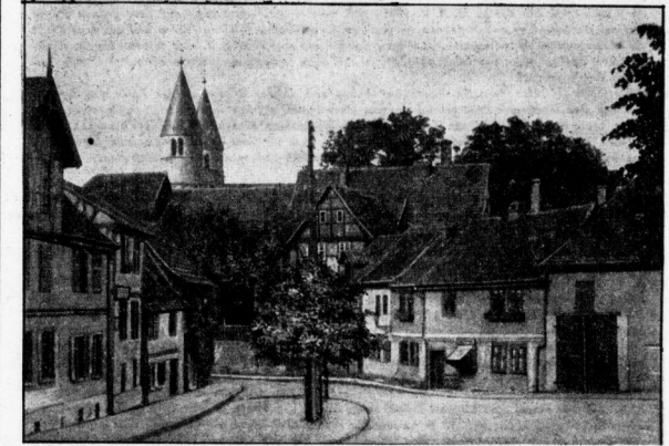
Im Waldwinkel von Gernrode.

So beginnt sich Gernrode mit der nächsten Aufgabe, das ist eine tausendjährige Geschichte hat. In dieser nächsten Aufgabe liegt eine räumliche Vergangenheit, denn der Mann, dem Gernrode seinen Namen dankt — Marzgraf Gero — ist eine Persönlichkeit innerhalb tausendjähriger deutscher Geschichte, wie sie ein Land nicht allzu häufig zu verzeichnen hat. Die vielen Chroniken rühmen den Marzgrafen als einen Vorkämpfer mit starkem Verstand, als ein strategisches Genie, einen treuen Verbündeten seines Vaters Otto I. und einen ebenso großzügigen Mann. Wenn die Geschichte weiter erzählt, daß der „Häselhof der Wenden“ nach einem Ostwall drei Tage lang erobert wurde, die den Marzgrafen in offener Feldschlacht nicht bezogen konnten und ihn deshalb mitsamt seinen Mördern, tut das den Charaktereigenschaften Geros keinen Abbruch. Vor tausend Jahren „heiligte der Zweck die Mittel“, ebenso, wie im Lauf der folgenden Jahrhunderte. (Im letzten waren die Sagen fürchten als gruselige und teuflische Wesen bekannt.) Ebenfalls bleibt es dabei, daß die Chronik im 14. Jahrhundert, den Marzgrafen Gero de beide unter allen an manigst und an „Auge“ (Zugenden) nennt.