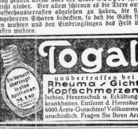
Die Zonklimvorführung im Heim.

Der Apparat, der das Zonklima, wurde nach jahrelangen Versuchen jetzt endlich geschaffen. Es ist eine Kombination von Schallplatte, Ventilator und Vorrichtung, die das Zonklima im Zimmer herstellt. Die Vorrichtung ist mit einem Ventilator verbunden, der das Zonklima im Zimmer herstellt.