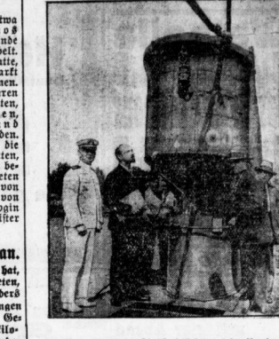
Wittfins (links in Zivil) beschäftigt sein Nordpol-U-Boot im Hafen von Philadelphia.