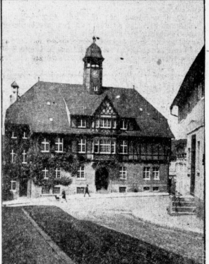
Das neue Rathaus.

Die 1000jährige Gernrode St. Coriati ist das Herz Geros und seit tausend Jahren das Wahrzeichen der Stadt im Harz. Es trägt die beiden Türme aus dem Städtchen, ein Meister-