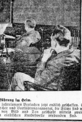
Die Zonklimvorführung im Heim.

Der Apparat, der das Zonklima, wurde nach jahrelangen Versuchen jetzt endlich geschaffen. Es ist eine Kombination von Schallplatte, Ventilator und Vorrichtung, die das Zonklima im Zimmer herstellt. Die Vorrichtung ist mit einem Ventilator verbunden, der das Zonklima im Zimmer herstellt.