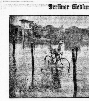
Der Berliner Siedlungen unter Wasser.

53 Gr. Ulrichstr. 53. 53 Gr. Ulrichstr. 53.