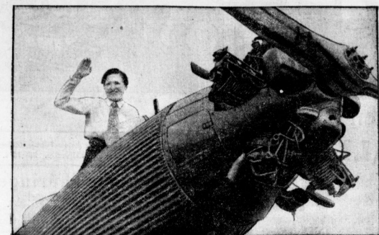
Die bekannte Berliner Sportfliegerin, die mit einem Flugzeug vom Flughafen Berlin nach Konstantinobel gestartet. Die Route geht über die Zischowstation, Cottbus, Uckermark, Potsdam, Scharnbeek, Nauen, Berlin.