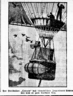
Der Dreiblack „Ceren“ des schwedischen Ingenieurs Andrés, mit dem er zum Nordpol fuhr.

Auf die Frage, ob wirklich eine Verwechslung zwischen André und Nobles Centen vorliegen konnte, erklärte Sagen, daß er daran nicht glauben würde, da die Leiche nach den vorliegenden Nachrichten vollständig ungeschädigt war.