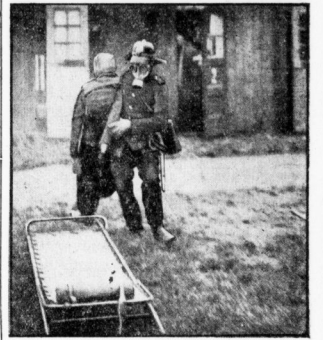
Sportliche Schulung für den Ernstfall: Rettung von „Menschenleben“ am Feuerort.

Die 100-Meter-Läufer, die 200-Meter-Läufer und dortmann gelangten Durchmittleistungen und hielten bis zum Ende durch. Der zweite Tag brachte in der Spitzengruppe meiste Reue. Die 100-Meter-Läufer, die 200-Meter-Läufer und dortmann gelangten Durchmittleistungen und hielten bis zum Ende durch.