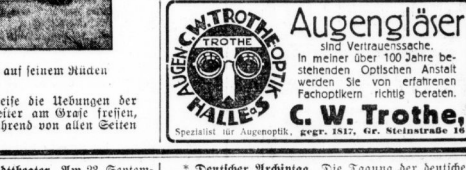
Augengläser sind Vertrauenssache. In meiner über 100 Jahre bestehenden optischen Anstalt werden Sie von erfahrenen Fachleuten richtig beraten.