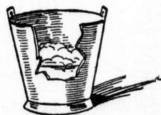
Ohne Henko wenig Schaum