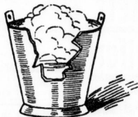
Mit Henko prächtiger Schaum