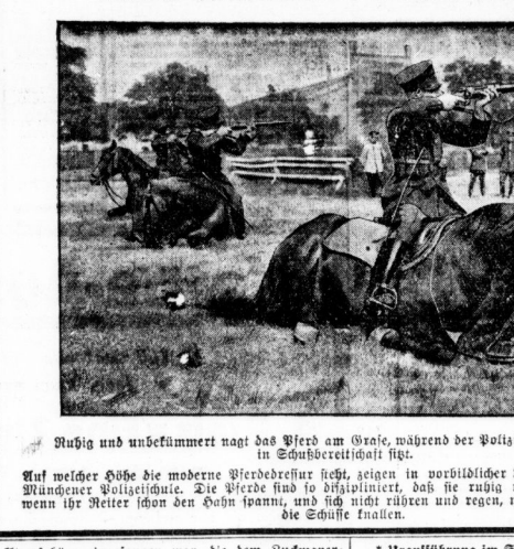
Rußig und unbekümmert nagt das Pferd am Gras, während der Polizist auf seinem Rücken in Substanzhaftigkeit sitzt.